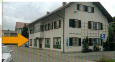
Um das Haus.

Jahnstraße 12, Marktoberdorf - im Haus der Begegnung