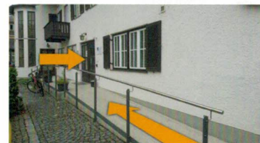
Rampe an der Rückseite.